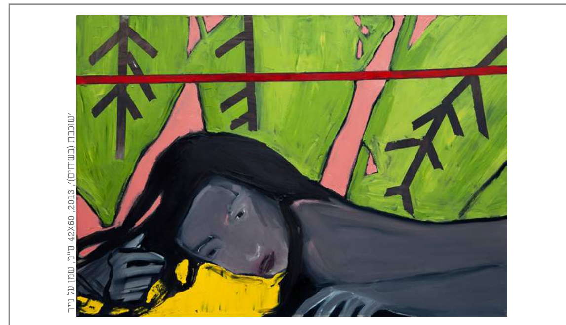
ישוכבת (בשיחים), 2013, 42x60 ס"מ, שמן על נייר