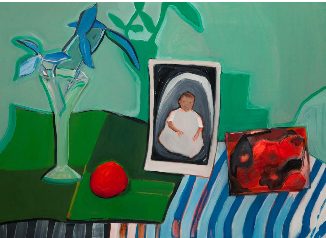
קלמנטינה, 2013, 50x70 ס"מ, שמן וטיפו יי על נייר