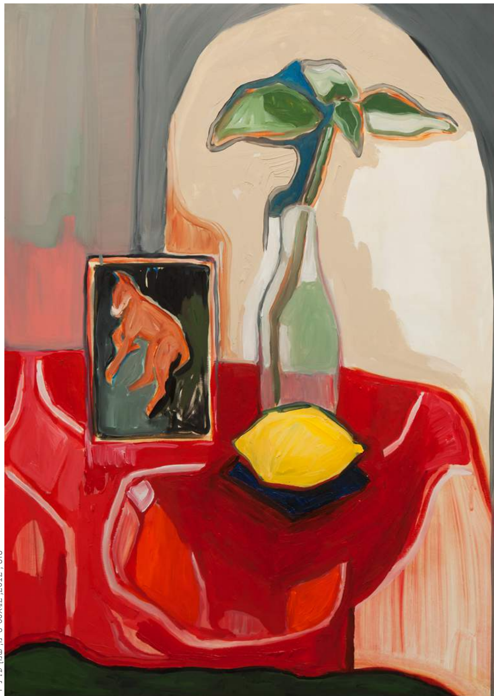
י"ט, 2012, 60X42 ס"מ, שמן על נייר

יערה אורן היא ציירת וצלמת, בוגרת 'המדרשה'. עבודותיה הוצגו, בין היתר, בגלריה 'אלפרד', 'חנינא', 'גלאון'. כמו כן, הציגה בגלריות נבחרות בעולם.