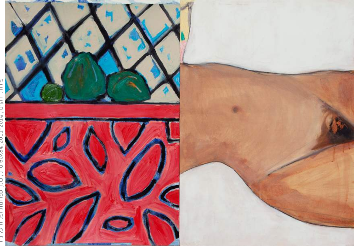
פירות ירוקים, 2011-2014, 60X84 ס"מ, שמן נפרדות ופדה על נייר

אני מבינה את הערכים של עבודה מהתבוננות, אבל אז לא הבנתי איך המציאות יכולה להיות להשתנות לדמיון.